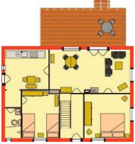
Der Grundriss der Wohnung im Erdgeschoss.