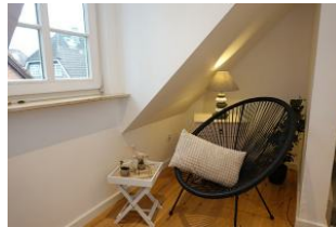
Das Lesezimmer im OG