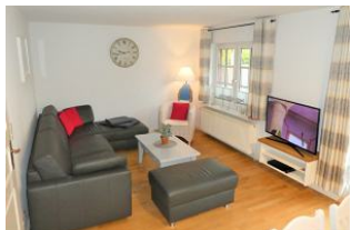
Das gemütliche Wohnzimmer.