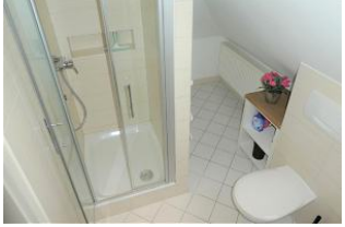
Das Duschbad im 1. OG.