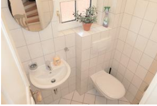
Das Gäste-WC im EG.