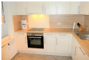
Die Küche ist komplett ausgestattet.