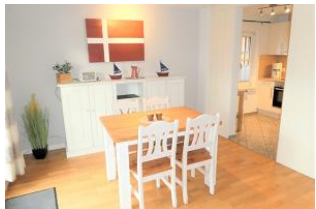
Der helle Essbereich bietet Platz für bis zu 4 Personen.

Das Lüttje Fischerhuus liegt in einer kleinen, ruhigen Nebenstraße von Wyk. In der Nähe finden sie alle Geschäfte des täglichen Bedarfs und sind nur wenige Minuten vom Wyker Südstrand entfernt. Diese helle und freundliche Doppelhaushälfte bietet Platz für bis zu 4 Personen und verteilt sich auf 2 Etagen. Im EG befindet sich das gemütliche Wohnzimmer mit schönem Essbereich und dem direkten Ausgang auf die eigene Terrasse. Die separate und gut ausgestattete Küche lässt keine Wünsche offen. Auch ein Gäste-WC ist im EG zu finden. Im 1 OG befinden sich zwei Schlafzimmer mit jeweils einem Doppelbett (180x200 und 140x200). Auch ein modernes Duschbad liegt in dieser Etage. Sie werden sich hier mit ihrer Familie wohlfühlen und gut erholen.