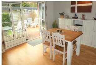
Hier befindet sich der direkte Ausgang auf die eigene Terrasse.