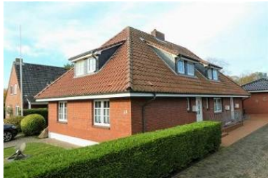
Das Haus von außen.

Die Unterkunft verteilt sich über EG und 1.OG.