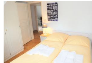
Das zweite Schlafzimmer mit kleinem Doppelbett (140 x 200)