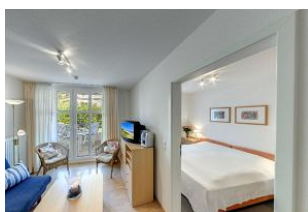
Blick in das Schlafzimmer