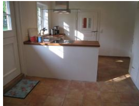
Hier von der anderen Seite zu sehen. Die Tür im Hintergrund führt ins Esszimmer