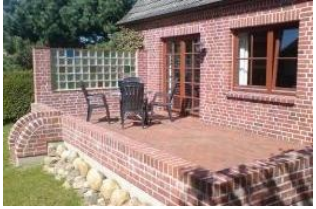
Ihre eigene Terrasse lädt zum Frühstück im Grünen ein.