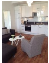
Wohnraum mit offener Küche