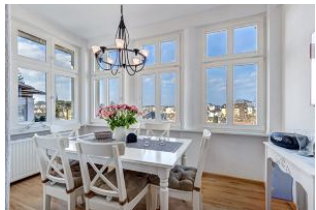
Essplatz in der Veranda mit schönem Ausblick

Geräumige helle 4-Zimmer-Wohnung mit Veranda Richtung Ostsee - mit schönem weitem Blick! Die Wohnung ist gemütlich und freundlich eingerichtet und ausgestattet. Sie wurde 2014 renoviert, die Bäder und Küche sind dann neu gemacht worden. Die Wohnung verfügt über drei separate Schlafzimmer, Wohnzimmer mit Küchenecke und Essplatz in der Veranda, ein Bad mit Wanne und Dusche, ein kleines Duschbad und einen Eingangsflur mit Garderobe. Die Wohnung verfügt über einen großen Balkon mit Esstisch. Zur Wohnung gehört ein kostenfreier Pkw-Stellplatz auf dem Grundstück. Ein zweiter kann hinzugemietet werden. Die Villa Margarete steht etwas erhöht in der Bergstraße, wodurch sich der weite Blick ergibt. Die Wohnung befindet sich im I. OG, etwa 300m zur Strandpromenade. Von der Villa Margarete aus können Sie das Ortszentrum und die bekannte Ahlbecker Seebrücke in ca. 8-10 Minuten zu Fuß erreichen.