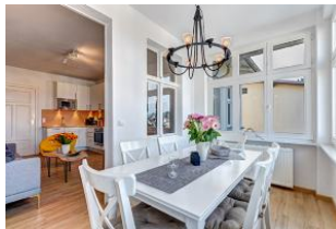
Veranda - Blick in den Wohnbereich mit Küche