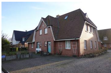
Das Haus Rungholtstr. 3b Die Wohnung Hanneke befindet sich rechts im EG