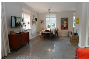
...der Blick zum Essbereich