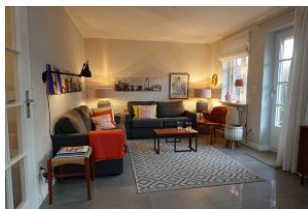
...in diesem Wohnbereich muss man sich einfach wohlfühlen...