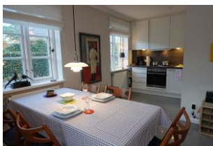
Esstisch und der Blick zur Küche