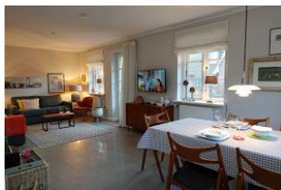
...der Blick vom Esstisch zum Wohnbereich