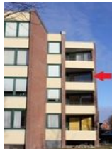
Im 2. OG befindet sich Ihre Wohnung, die mit dem Fahrstuhl ohne Anstrengung zu erreichen ist.