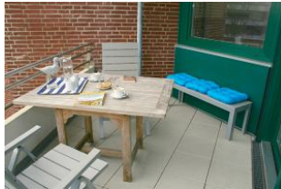
Auf dem großzügig geschnitten Balkon können Sie wunderbare Urlaubsstunden verbringen.