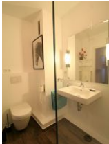
Das renovierte Badezimmer ...