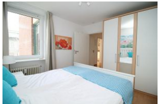
Ein großer Kleiderschrank steht Ihnen für die gesamte Urlaubsgarderobe zur Verfügung.

Herzlich Willkommen in der Ferienwohnung Strandmohn, im Haus Flora. Die Ferienwohnung liegt im 2. OG einer kleinen Apartmentanlage, die 60m² verteilen sich auf 3 Zimmer. Die Wohnung ist mit dem Fahrstuhl mühelos zu erreichen. Die Wohnung ist liebevoll und modern eingerichtet. Bereits beim Frühstück auf dem Balkon haben Sie eine wunderbare Sicht auf den Wyker Südstrand und die Nordsee. Der perfekte Ort um einen traumhaften Urlaub zu erleben! Wir freuen uns auf Sie!