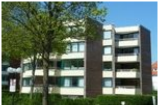
Das Haus von außen.