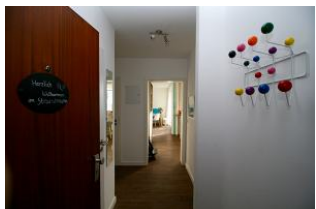
Ihr Eingang in das Urlaubsparadies.