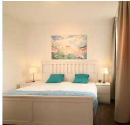
Das Schlafzimmer mit gemütlichem Doppelbett.