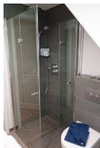
...und Duschkabine, aus Echtglas, sehr bequem: die Glaswand ist komplett weg zu klappen.