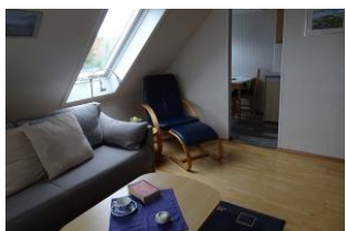
Das helle Wohnzimmer lädt zum Relaxen ein.

Das Haus "Pidder Lyng" - gelegen in Utersum - bietet Ihnen alles, was Sie sich für einen erholsamen Urlaub wünschen können. Das Dorfzentrum befindet sich 800 Meter entfernt und der schönste Strand der Insel ist in wenigen Gehminuten erreichbar. Die helle, sonnige Ferienwohnung mit Balkon verfügt über einen Schlafraum, eine separate Küche, ein Badezimmer mit Dusche sowie einen kombinierten Wohn-/Schlafraum. Alle Räume wurden mit viel Liebe zum Detail eingerichtet. Die hochwertige Ausstattung reicht vom eigenen Parkplatz, über Backofen und Geschirrspüler bis hin zum WLAN-Anschluss.