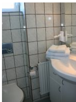
Das Badezimmer mit Dusche.