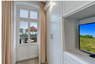
Flachbildfernseher im Schlafzimmer