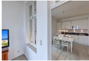
Blick in die Wohnküche