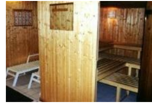
Die kleine Sauna im Keller des Hauses.