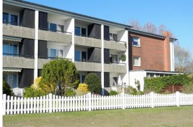
Das Matthias-Petersen-Haus von außen.