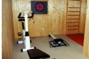
Der kleine Fitnessraum im Keller des Hauses.