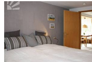
Schlafzimmer mit Einbauschränk