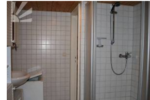
grosses Bsd mit Dusche, WC, Waschmaschine