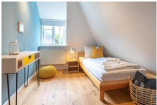
Schlafzimmer mit Einzelbett