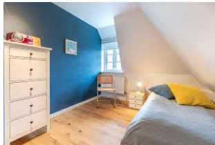
Schlafzimmer mit Einzelbett