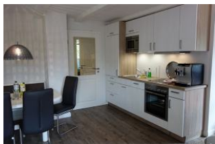
Die offene Küchezeile, links im Bild: der Essplatz