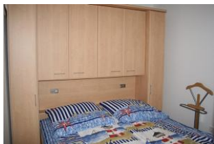
Das Schlafzimmer mit Doppelbett und viel Stauraum für Ihr Urlaubsgepäck.