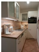
Die gut ausgestattete Küchenzeile.