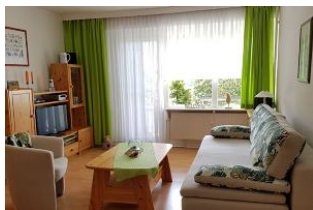
Das gemütliche Wohnzimmer mit direktem Ausgang auf die kleine Terrasse.

Wenn Sie in Ihrem Urlaub Ruhe und gleichzeitig die Nähe zum Strand und ins Zentrum suchen, sind Sie hier im Kapitän-Matthias-Petersen-Haus am Rande von Wyk gut aufgehoben. Das Haus befindet sich in einer ruhigen Wohnlage. Zum Südstrand sind es ca. 10-15 Gehminuten. Die mit viel Liebe zum Detail eingerichtete Zwei-Zimmer-Wohnung (für bis zu 4 Personen) bietet auf ca. 41 m 2 alles für einen angenehmen Urlaub. Sie ist allergikerfreundlich eingerichtet und befindet sich im Erdgeschoss der Wohnanlage.