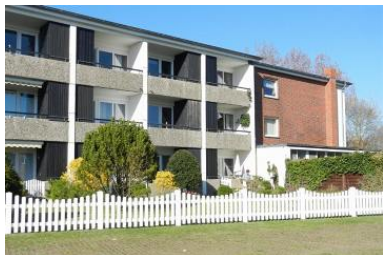
Das Matthias-Petersen-Haus von außen.