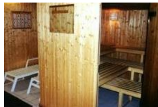
Die kleine Sauna im Keller des Hauses.