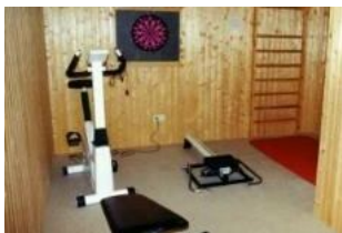
Der kleine Fitnessraum im Keller des Hauses.