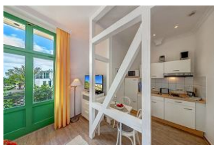
Wohnen / Schlafen