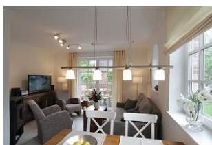
Blick in das Wohnzimmer