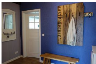
Der Flur mit großer Garderobe...