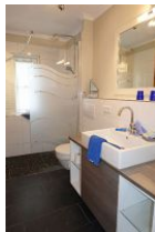
Das Bad mit Handwaschbecken, Toilette und bodengleicher Dusche mit ....

Ein großer Einbauschränk für die Kofferinhalte. TV Gerät.