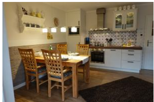
Der Essplatz, im Hintergrund die Küche.