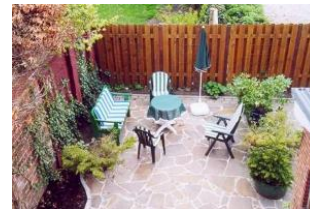
Den Gästen des Hauses steht eine Gemeinschaftsterrasse zur Verfügung.