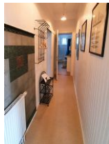
Der kleine Flur der Wohnung.