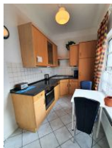
Die kleine Küche ist gut ausgestattet.