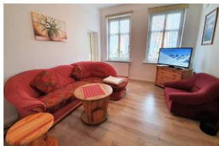
Das Sofa mit Schlaffunktion.

Dieser für Föhr typische rote Backsteinbau liegt am Rande der Wyker Innenstadt. Zentral und doch ruhig, ideal zum Erholen. Sie sind in wenigen Minuten im Zentrum, auf der Promenade oder am Strand. Alle Einkaufsmöglichkeiten sind schnell zu erreichen. Marina 1 ist eine helle, gemütliche EG- Wohnung mit einem Schlafzimmer mit Doppelbett, einem freundlichen Wohn-Schlafzimmer mit einer bequemen Schlafcouch, einer voll ausgestatteten Ess-Küche und einem Tageslichtbad. Zur Wohnung gehört eine nette Gemeinschaftsterrasse im hinteren Teil des Gartens.