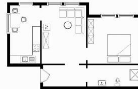
Der Grundriss der Wohnung.