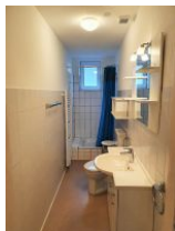
Das Duschbad mit Tageslicht.