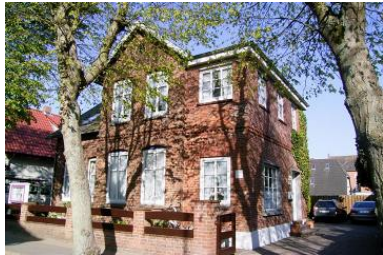
Strandnah, ruhig und dennoch zentral - Herzlich Willkommen im Haus Marina.