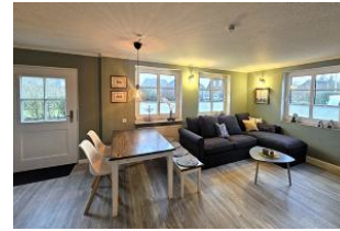
Der gemütliche Wohnschlafraum ist lichtdurchflutet und bietet zusätzlich eine nette Ess- und Sitzgruppe an.