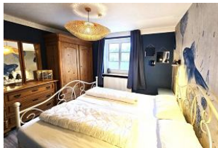
Auch hier befindet sich genügend Stauraum für Ihre Urlaubsgarderobe.