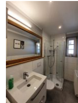
Das hellgeflieste Duschbad mit Fenster.