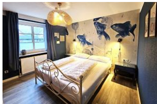
Für erholsamen Schlaf sorgt das liebevoll eingerichtete Schlafzimmer.

Das Haus Nis Puk ist nur ca. 800 m vom Dorfkern Utersum entfernt, so dass Sie fußläufig alles erreichen können, was Sie für den täglichen Bedarf benötigen. Der Strand ist nur wenige Gehminuten entfernt, hier kann man die phänomenalsten Sonnenuntergänge der gesamten Insel erleben. Die im Erdgeschoss befindliche Wohnung mit Terrasse & gemeinschaftlichem Garten sowie Spielplatz ist mit ihren ca. 50 qm groß genug für 2 bis 4 Personen und besitzt alles, was Sie sich für einen erholsamen Urlaub wünschen: Von dem eigenen Parkplatz, dem Wohnschlafraum mit WLAN, dem gemütlichem Schlafzimmer, einem Bad mit Dusche bis zu einer vollausgestatteten Kochnische.