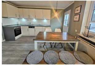
Die neue und helle Kochnische der Ferienwohnung Nis Puk mit Backofen und Geschirrspüler.