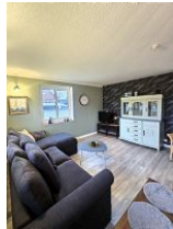
Die moderne Fernsehcke.