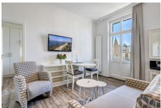
Blick in den Wohnraum

Wir bauen diese Wohnung bis Ostern 2021 für Sie um! Es entsteht direkt an der Strandpromenade - 1. Reihe mit SÜDBALKON - ein schönes 2 - Zimmer - Apartment im I. OG mit moderner Einrichtung, separater Küchennische, Duschbad, Südbalkon mit Sonne bis abends. Die Wohnung verfügt über einen Pkw-Stellplatz. In der Garage können Fahrräder und ähnliches untergestellt werden. Im Haus gibt es eine Sauna. Von der "Villa Germania" aus können Sie das Ortszentrum und die bekannte Ahlbecker Seebrücke in ca. 3 Minuten zu Fuß erreichen. Zum Strand sind es 50 m. Von Mai bis September ist ein Strandkorb im Tagespreis enthalten. Der Grundriss ist der der renovierten Wohnung. Die Bilder sind noch die der unrenovierten Wohnung und werden durch neue Fotos ersetzt, sobald diese vorliegen.