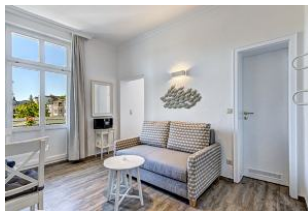
Couch im Wohnraum