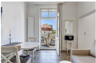
Wohnbereich mit Blick zum Balkon