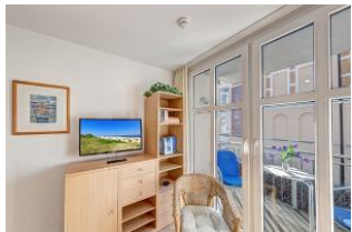
TV und Balkon

Direkt an der Strandpromenade mit SÜDBALKON und FAHRSTUHL im Haus! Schönes gemütliches 2-Zimmer-Apartment mit moderner guter Ausstattung. Separates Schlafzimmer (mit Fernseher), Wohnzimmer mit Küchenzeile und Essplatz, Duschbad, Balkon nach Süden mit Sonne bis abends. Die Wohnung verfügt über einen Tiefgaragen-Pkw-Stellplatz. In der Garage können auch Fahrräder und ähnliches untergestellt werden. In unserer "Villa Germania" nebenan gibt es eine Sauna. Von der "Villa Aquamarina" sind es zum Ortszentrum und der Seebücke ca. 3 Minuten zu Fuß. Zum Strand sind es 50 m.