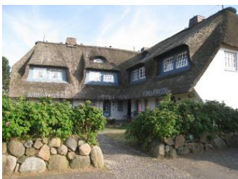
Das Eckhus im Hochstieg 22

Die Unterkunft verteilt sich über EG, 1.OG und DG.