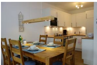
Der Große Esstisch hat für Jeden ein Plätzchen. Im Hintergrund die Küche.