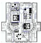
Wohnungsgrundriss (Möblierung exemplarisch)