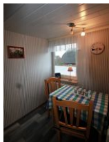
Die gemütliche Sitzecke in der Küche.