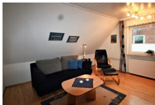
Der gemütliche Wohnbereich lädt zum Ausruhen und Entspannen ein.