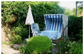
Zur Ferienwohnung gehört diese schöne Sitzecke mit Strandkorb im gemeinschaftlichen Garten.

Das Haus "Pidder Lyng" - gelegen in Utersum - bietet Ihnen alles, was Sie sich für einen erholsamen Urlaub wünschen können. Das Dorfzentrum befindet sich nur 800 Meter entfernt und der schönste Strand der Insel ist in wenigen Gehminuten erreichbar. Die helle, sonnige Dachgeschosswohnung verfügt über alles, was man sich für einen entspannten Urlaub wünscht. Angefangen vom Backofen und Geschirrspüler bis hin zum WLAN-Anschluss und nicht zu vergessen der Sitzecke mit Strandkorb im Garten. Die Eigentümer haben die Wohnung mit viel Liebe zum Detail gemütlich und stilvoll für Sie eingerichtet.