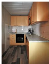
Die separate Küche ist vollausgestattet und verfügt über Backofen, Geschirrspüler und Mikrowelle.