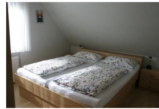
Das freundliche Schlafzimmer bietet erholsamen Schlaf in dem ruhigen Örtchen Utersum.