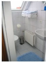
Das Badezimmer mit Dusche