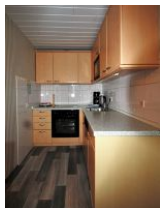
Die separate Küche ist vollausgestattet und verfügt über Backofen, Geschirrspüler und Mikrowelle.