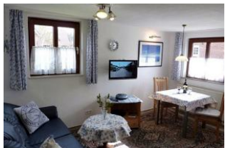
Ihr heller Wohn- und Essbereich.

Im Anbau dominieren blaue Möbel im friesischen Stil. Besonders geeignet für preisbewusste Singles, die in einer ruhigen und dennoch zentralen Gegend wohnen möchten. Ein kleines "Ferienhaus" mit direktem Zugang zum Garten und einer gemütlichen Sitzmöglichkeit auf der sonnigen Südseite.