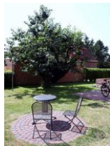
Ihr eigener Sitzbereich an der Südseite.