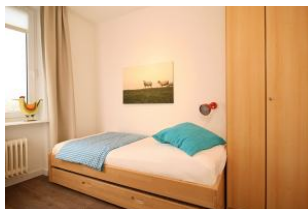
Das gemütliche Kinderzimmer