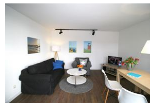
Das gemütliche und großzügig geschnittene Wohnzimmer ...