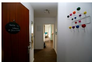
Ihr Eingang in das Urlaubsparadies.