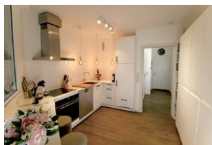
Die Küche ist bestens ausgestattet. Hier macht das Kochen Spaß.