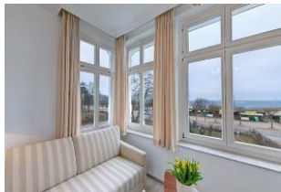
Blick aus Veranda