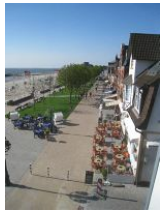
Der Blick auf den neu gestalteten Sandwall

In diesem, fast 100 Jahre alten Stadthaus wohnt man wirklich "mittendrin". Auf der geschlossenen Veranda, die Wind und Wetter abhält, den Blick auf die Promenade aber freigibt, könnte man den ganzen Tag verbringen. Den Menschen zusehen, entfernt die "Kurmusik" hören, aufs Meer schauen - eben einfach die Seele baumeln lassen. Das ist Erholung pur. Die modern eingerichtete Wohnung mit dem Charme alter Gemäuer liegt im 2.OG des Hauses und bietet 2 Personen ausreichend Platz für einen erholsamen Urlaub. Aber Achtung: dies alte Haus hat auch alte Treppen. Lang, steil und kurze Stufen. Allein vom Hauseingang in die 1.Etage müssen Sie 17 Stufen bewältigen.