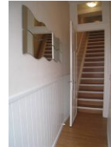
Die lange Treppe (17 Stufen) vom Hauseingang zur 1.Etage