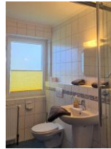
Bad mit Dusche