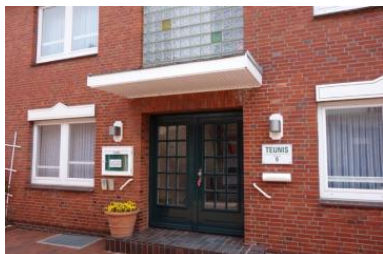
Das Haus Teunis in der Mühlenstr. 9 / Ecke Carl-Häberlin-Str. in Wyk