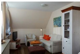
Eine gemütliche Wohncke mit TV Gerät