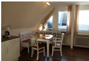
Der Essplatz an der offenen Küche