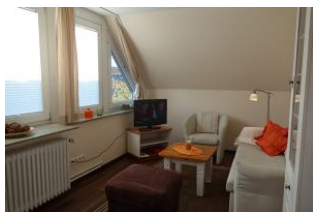
Große Fenster durchfluten den Raum mit Sonne