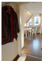
Der kleine Flur mit Garderobe