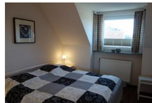
Das Schlafzimmer mit großem Doppelbett...