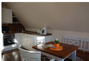
Die offene Küchenzeile