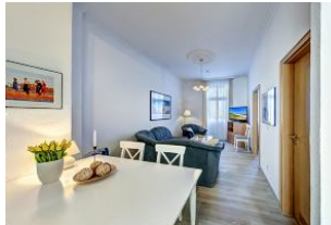
Wohnraum mit direktem Zugang zum Garten und dortiger Terrasse