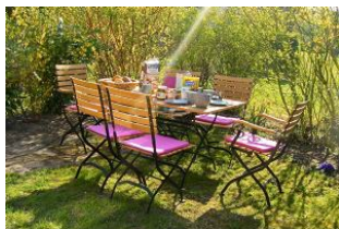
Frühstück im Garten