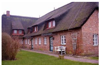
Aussenansicht des Hauses

Laerchenhus ist Teil eines ehemaligen altfriesischen denkmalgeschützten reetgedeckten Bauernhofes im historischen Kern des Inseldorfes Borgsum. Dieser Anbau befindet sich in der Seitenstrasse Alles neu und modern eingerichtetes Hausteil. Der große Garten wird von alten Laubbäumen beschattet. Über zwei Ebenen verteilt, bietet Ihnen unser Ferienhaus 'Laerchen's Hus' ein stilvolles Wohnen in behaglicher Atmosphäre ankommen und wohlfühlen. Im Erdgeschoss bietet Ihnen diese Wohnung viel Raum in dem grossen Wohnzimmer und der abgeteilt Küche mit dem grossen Esstisch. Auch wenn das Wetter mal nicht mitspielt können sie sich hier erholen, Im 1 OG befinden sich 3 Schlafzimmer und das Badezimmer mit Dusche und WC. Für gemeinsame Abende sind Gemeinschaftsspiele vorhanden, aber auch Bücher und Wlan Nutzung ist möglich. Hunde sind herzlich willkommen.