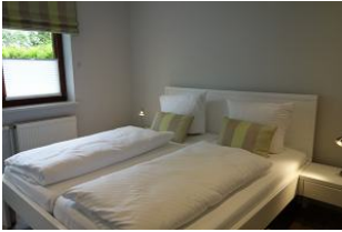
...und das zweite Schlafzimmer mit Doppelbett und..