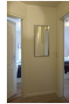
Vom Flur geht es in zwei Schlafzimmer.