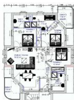
Wohnungsgrundriss (Möblierung exemplarisch)

STRANDNAH, GROSS, MODERN! Mit 2 BALKONEN (je ca. 8 qm), FAHRSTUHL, nur ca. 100 m zur STRANDPROMENADE! Großzügige elegante 4 - Zimmer - Wohnung mit sehr guter Ausstattung! 3 separate Schlafzimmer, 3 Bäder (2 davon ensuite), alle mit Fußbodenheizung. Die ensuite-Bäder verfügen über Wanne und Dusche bzw. Dusche. Das dritte Bad ist ein Duschbad. Der große Wohnbereich verfügt über eine vollausgestattete Küchenzeile, einen Eßbereich und einen Couchbereich mit KAMINOFEN. Die Balkone sind möbliert. Zur Wohnung gehört ein STRANDKORB AM STRAND. Die Wohnung verfügt über einen Pkw-Stellplatz in der teilüberdachten Tiefgarage. Fahrradabstellfläche ist vorhanden. Vom Haus aus können Sie das Ortszentrum und die bekannte Ahlbecker Seebrücke in ca. 2 Minuten zu Fuß erreichen.