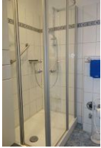
die Duschkabine mißt 90x75, niedrige Duschwanne