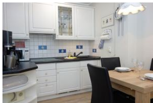
Die offene Küche