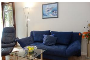
...gemütliche Couch und Relaxsessel

Die Ferienwohnung "Edith" in der Feldstr. 18 gesellt sich zu den anderen zwei Wohnungen, die wir im Haus schon vermieten. Kleines, komfortables Feriendomizil inmitten unseres Städtchens Wyk. Wohnzimmer mit Austritt auf den Balkon und offener Küchenzeile, Schlafzimmer mit großem Kleiderschrank, Kleines, jedoch sehr geschickt gestaltetes Duschbad und ein Flur. Mehr braucht man nicht. Fahrradständer und Parkplatz zur Wohnung zugehörig finden Sie hinter dem Haus.