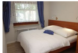
Das Doppelbett im Schlafzimmer, 160x190 ohne Fußteil Einzelmatratzen