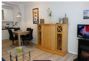
Der Blick zur Küche, im Vordergrund das TV Gerät