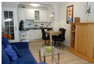
Der Blick zum Esstisch, im Hintergrund die Küche