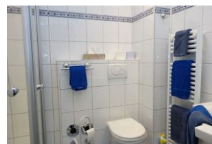
Das kleine, aber feine Bad.