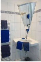
Das Waschbecker mit spezieller Spiegellösung