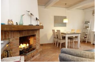
Der Blick zum Esstisch.