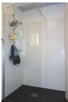
...mit großem Duschbereich.