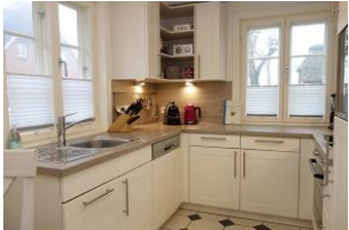
Die separate Küche mit...