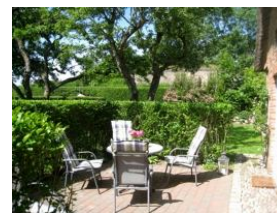
...hier läßt es sich aushalten....