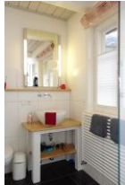
Das Bad im Erdgeschoß...