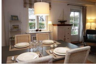
Der große Essplatz im Wohnzimmer.