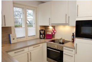
... Backofen und Mikrowelle