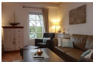
Ein großzügiges Wohnzimmer erwartet Sie.... (im Hintergrund die Terrassentür)