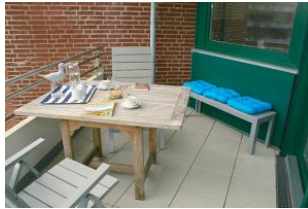
Auf dem großzügig geschnittenen Balkon können Sie wunderbare Urlaubsstunden verbringen.