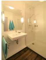
... mit großzügiger Dusche.