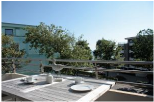
Bereits beim Frühstück auf dem Balkon können Sie den Blick auf die Nordsee genießen.