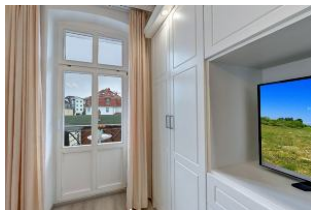
Flachbildfernseher im Schlafzimmer